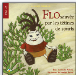
Flo sauvée par les tétines de souris 978-2923518-10-7