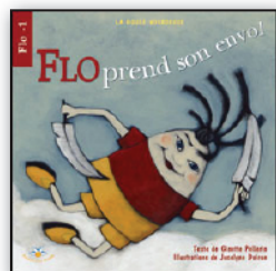
Flo prend son envol 2-922203-36-0